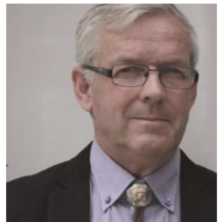
av TORSTEIN T. RØYNE

Innenfor den materialistiske vitenskapens skigard hersker regelen om at alt skal kunne måles, veies og bevises.